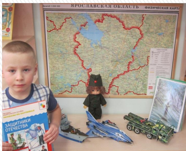
Расскажу сверстникам : «Какой он - солдат?»