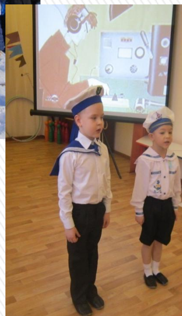
Концерт «Наследники Победы»

Исследовательская деятельность позволяет формировать у детей внутреннюю мотивацию на приобретение знаний о семье, городе, стране, овладение культурными традициями русского народа