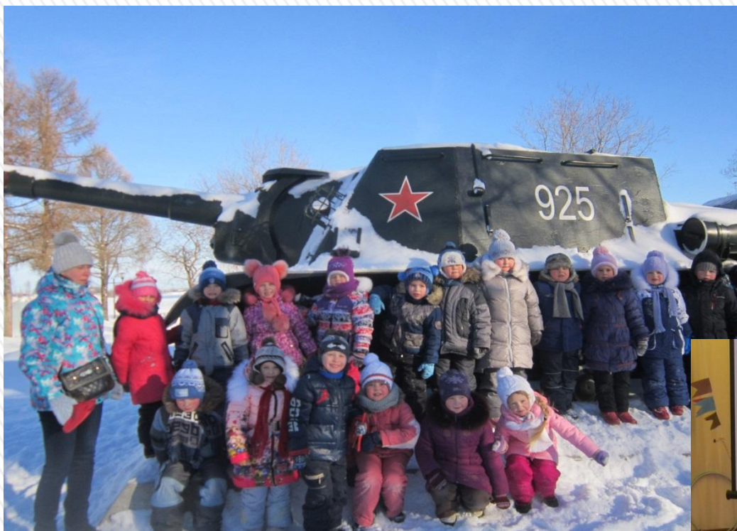
Экскурсия на Аллею Славы

Исследовательская деятельность позволяет формировать у детей внутреннюю мотивацию на приобретение знаний о семье, городе, стране, овладение культурными традициями русского народа