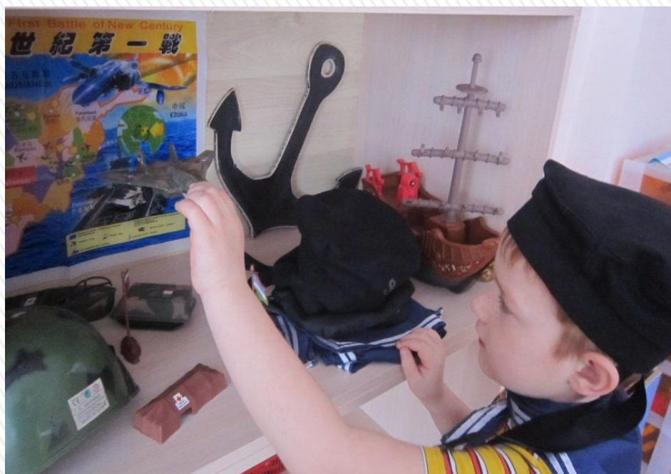
Игра «Мы – военные»