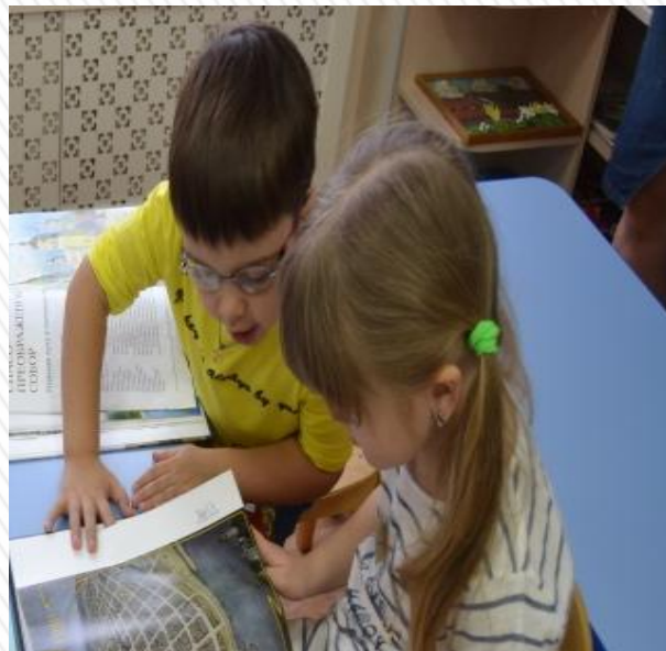
Рассматриваем книгу «Рыбинск»

Излагаем добытую информацию, доказываем свою точку зрения, отвечаем на вопросы