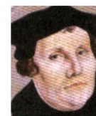
М. Лютер (1483 – 1546)