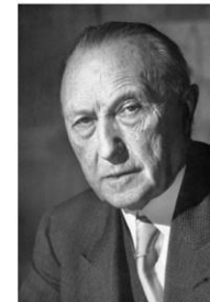
Конрад Аденауэр (1876 – 1967) Федеральный канцлер Германии в 1949 – 1963.