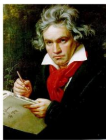
Людвиг Ван Бетховен (1770 – 1821) Композитор, пианист, дирижёр. Представитель венской классической школы.