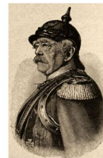
Отто фон Бисмарк (1815 – 1898) Князь, 1-й рейхсканцлер германской империи в 1871