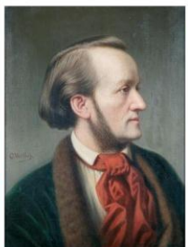
Рихард Вагнер (1813 – 1883) Композитор, дирижёр, музыкальный писатель. Крупнейший