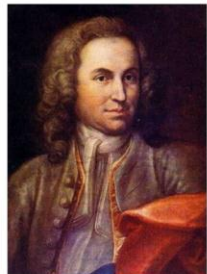
Иоганн Себастьян Бах (1685 – 1750) Композитор, органист, клавесинист.