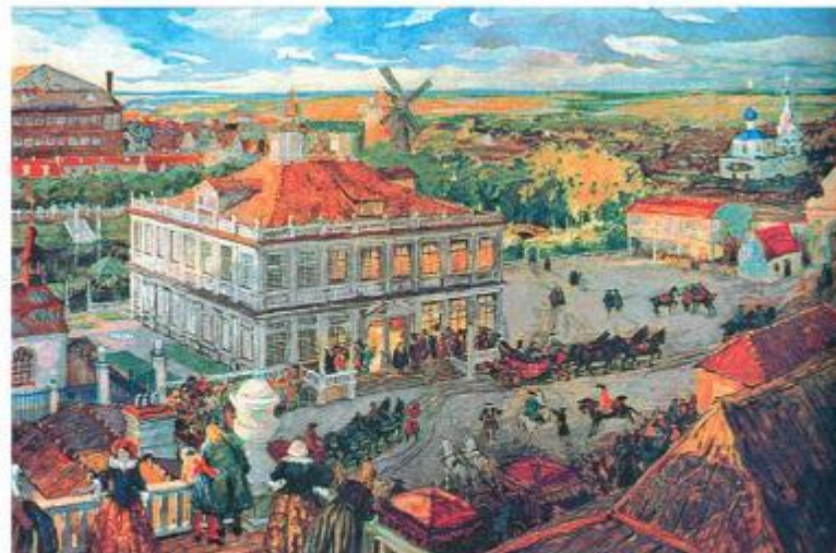
Немецкая слобода в Москве. Бенуа А.Н.