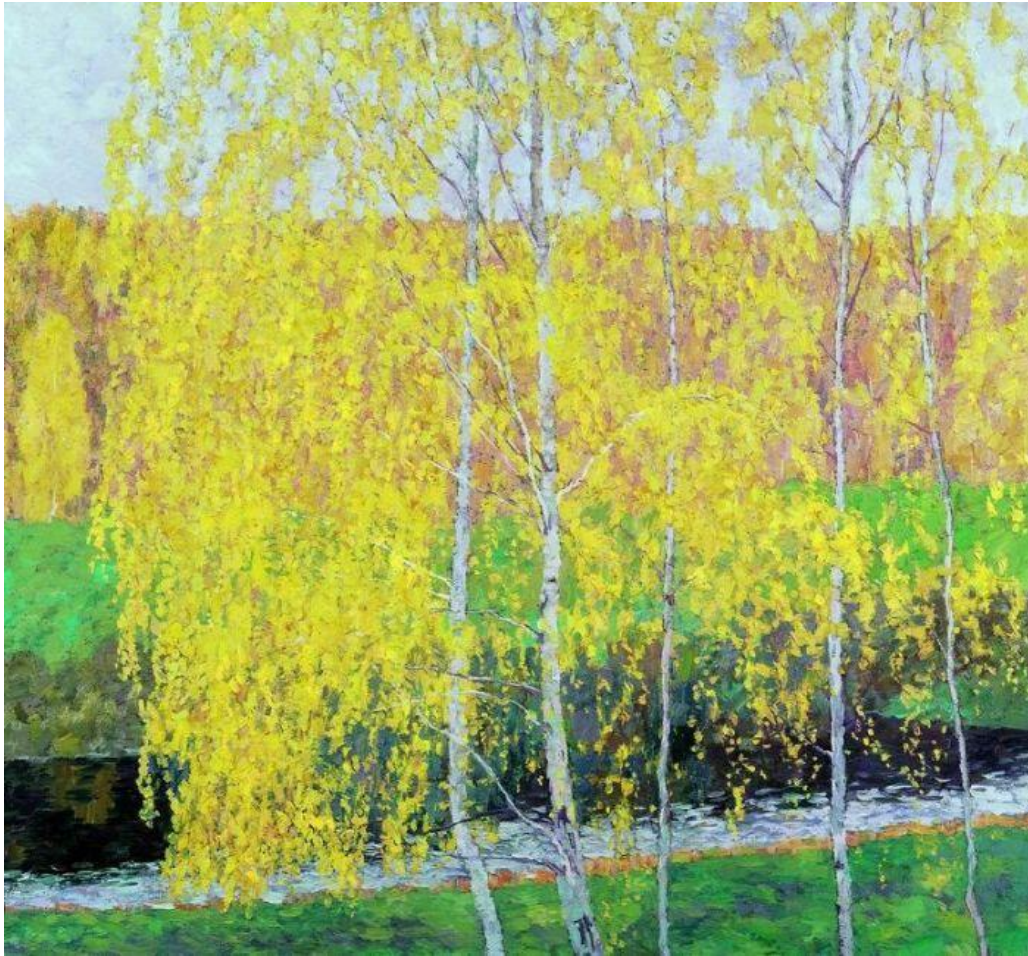
Е.Зверьков «Золотая осень», 1975г.